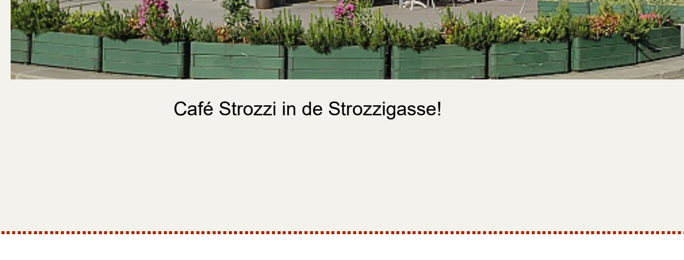
Café Strozzi in de Strozsigasse!